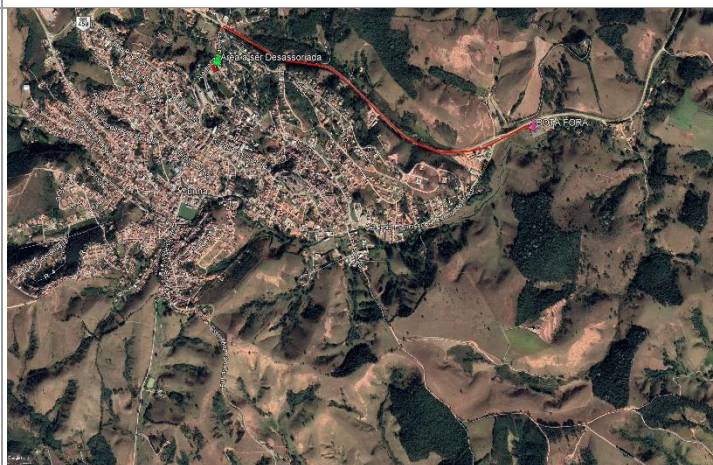
Foto 04 – Percurso entre o local a ser desassoreado e o local do 2º Bota fora com uma distância de 2km