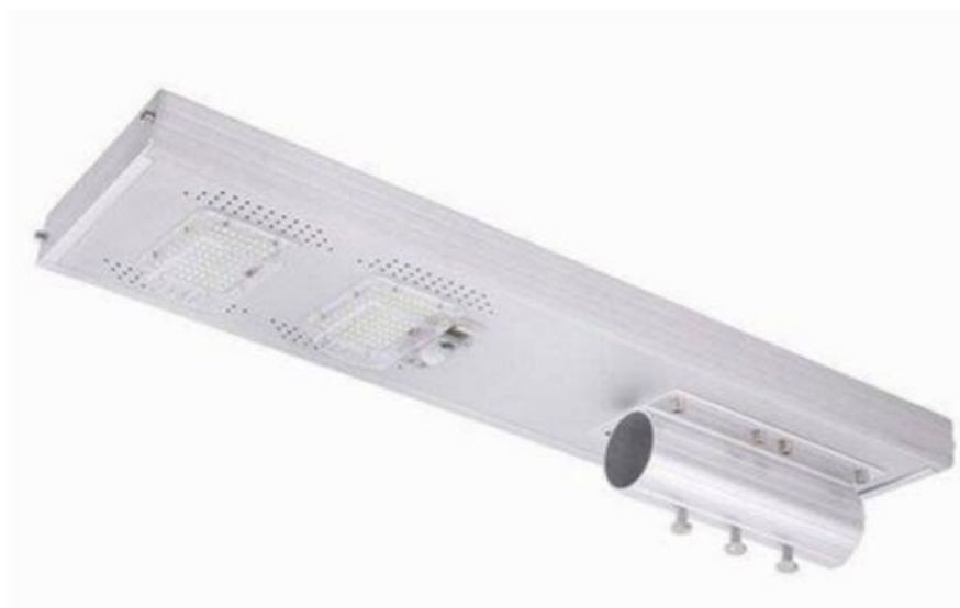
Figura 2 - Luminária Solar LED 150 W

Fornecimento e instalação de luminária solar led 150W de alto desempenho; luminária LED integrada com painel solar, bateria de lítio e sensores; Proteção IP65; a luminária acende automaticamente ao anoitecer, em modo dimerizado, e aumenta a luminosidade para o máximo ao detectar movimentos;